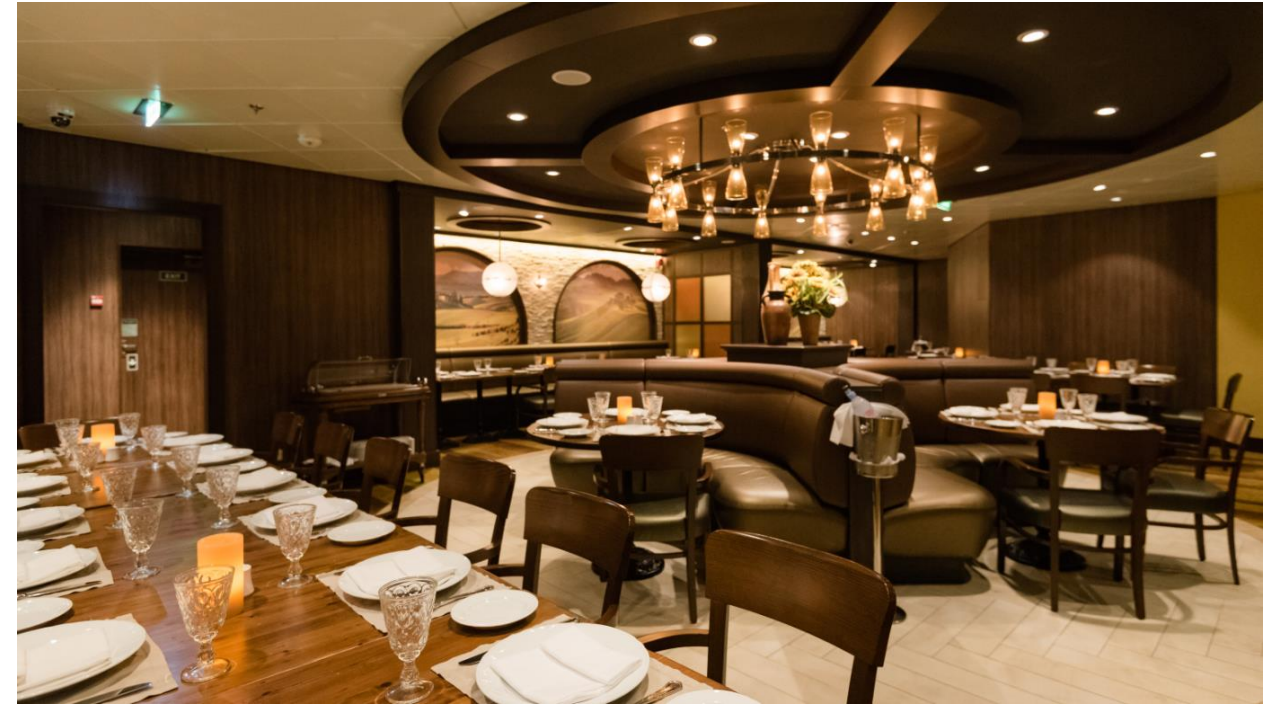
吉瓦尼意式餐廳 (Giovanni's Table)