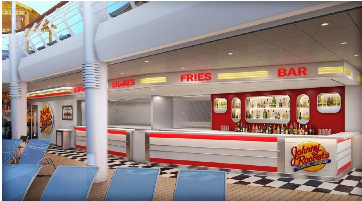
尊尼火箭餐廳 (Johnny Rockets)