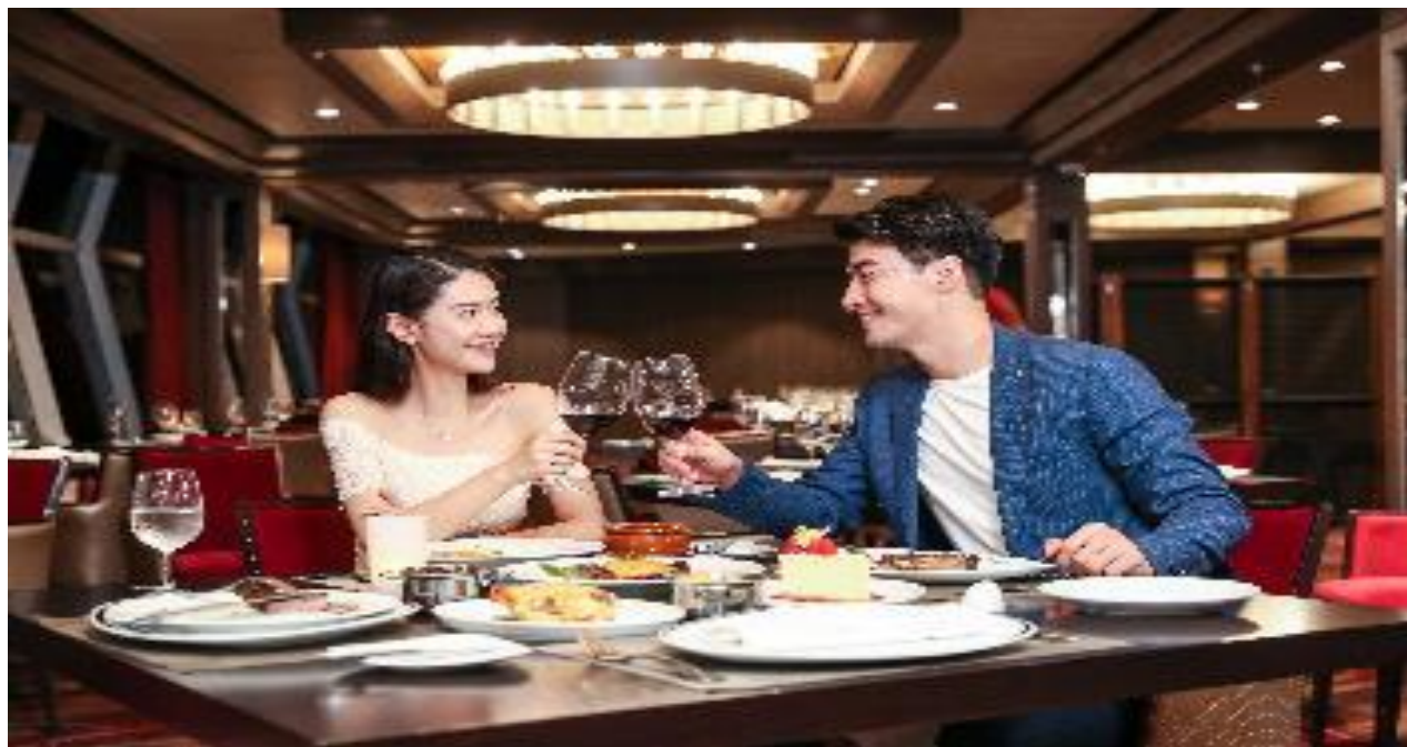
美式扒房 (Chops Grille)